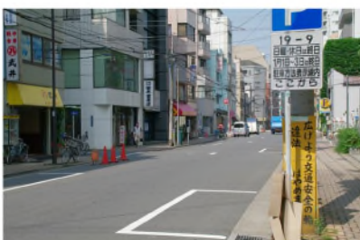
アーケードを出口より進行方向を見る。