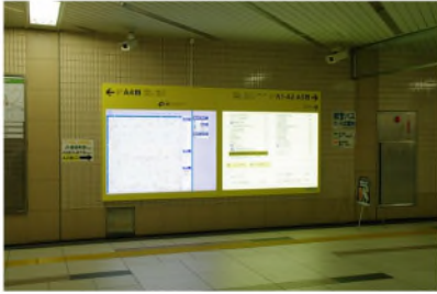
改札を出たところ。右手に進む。