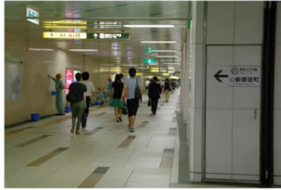
改札を出て進行方向を見る。 約200m直進