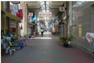
コンビニの角を右折し、進行方向を見る。