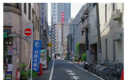
新川屋酒店の角を入り、約10m、左側に 入口があります。