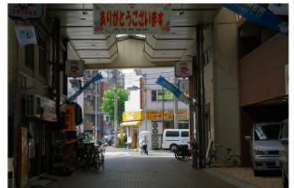
アーケード出口。出たら右折。 正面はカレーショップ(c)。