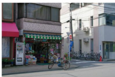
アーケード出口から約60m、左側に 新川屋酒店(d)。