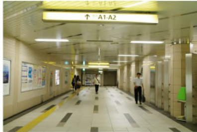
改札を出て進行方向を見る。 約30m直進