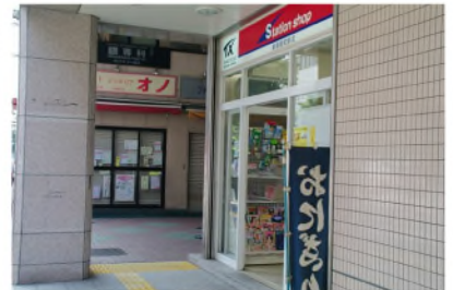
階段上から、右手を見る。 コンビニ(a)の角を右折。