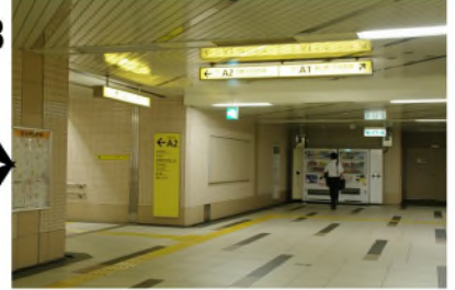
左側にA2出口があります。