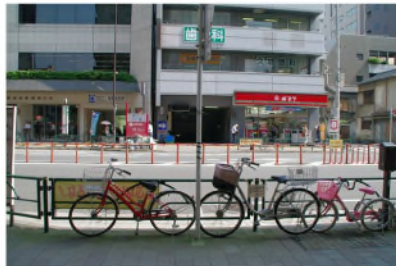
階段(エスカレータ)上