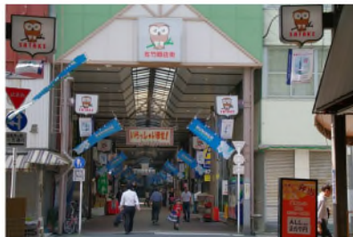
アーケード途中(b地点)。ここは直進。