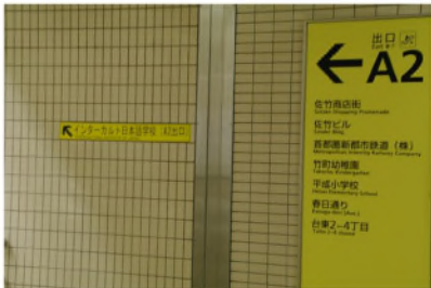
A2出口階段(エスカレータ)下