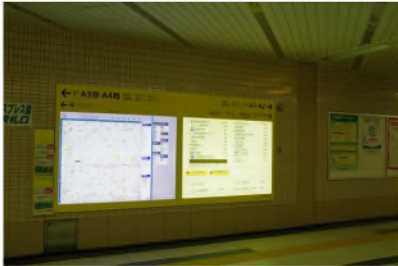
改札を出たところ。右手に進む。