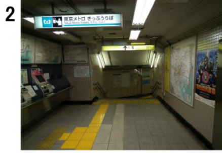
2 改札を出て左手を見る。