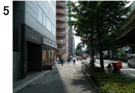
5 1番出口階段上から約150m。左角は御徒町小町食堂(b)。そこを左折。