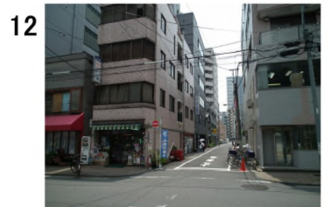
12 新川屋酒店の角を入り、約10m、左側に入口があります。