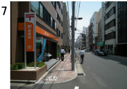
7 御徒町小町食堂の角から約50m。左に台東3郵便局(c)