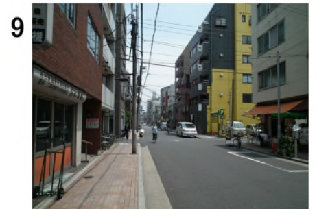
9 八百屋さん(d)と黄色いビルの前をさらに直進。