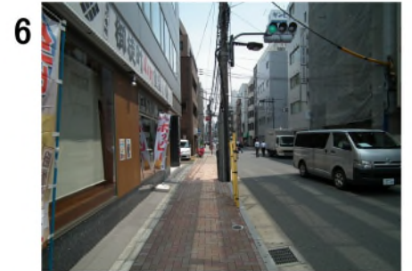
6 左折したところから、進行方向を見る。ここから約400m直進。