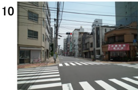
10 2つ目の信号。ここも直進。