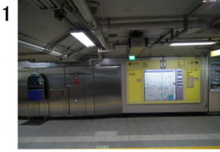
1 仲御徒町駅の秋葉原方の改札を出て、左手へ。