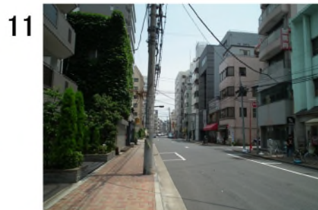
11 2つ目の信号の約60m先右側に新川屋酒店(e)。