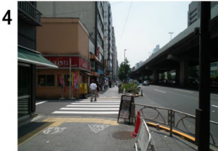
4 階段の約10m先から進行方向を見る。向こう側の角は立ち食いそば屋(a)