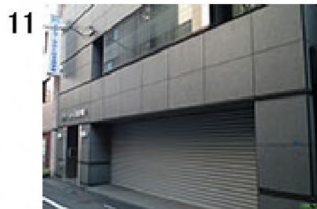
11 看板の下の自動ドアからお入りください。