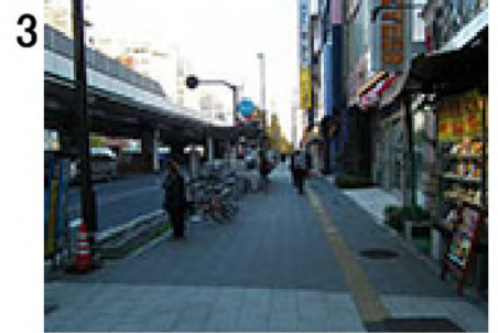
3 横断歩道を渡ったところから進行方向を見る。約10m先に東京メトロ秋葉原駅1番出口( c )。ここから約500m直進。