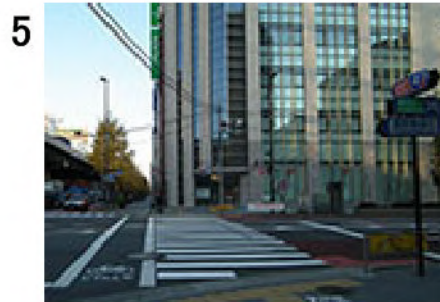
5 駅前の横断歩道から約500m、4つ目の信号が台東一丁目交差点。正面のビルは朝日信用金庫( e )。