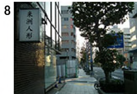
8 二長町交差点から約100m。米州人形の看板(米州ビル、 g )。この角を左に入る。