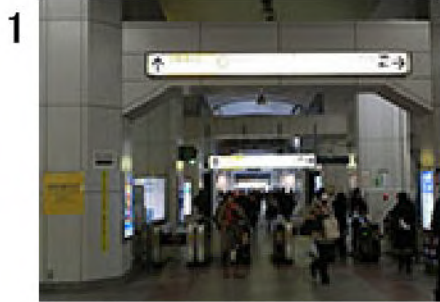
1 JR秋葉原駅昭和通り口改札(地図 a )。改札を出て直進。