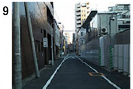
9 米州ビルの角から進行方向を見る。