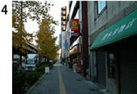
4 駅前の横断歩道から約350m地点。右にデイリーヤマザキ( d )。