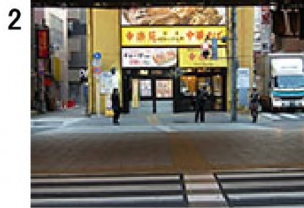
2 駅を出たところが昭和通り( b )。駅前の横断歩道を渡り、左手に進む。