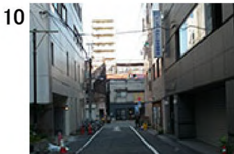
10 米州ビルの角から約150m、突き当りの右手前2件目が当校。