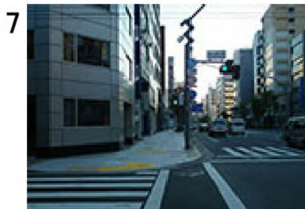
7 台東一丁目交差点より約約300m、二長町交差点( f )。さらに約100m直進。