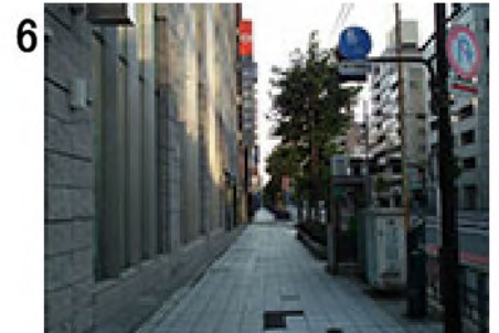
6 台東一丁目交差点を渡り、右折。朝日信用金庫前より進行方向を見る。ここから約400m直進。