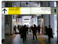
JR 아키하바라역 쇼와도오리 출구